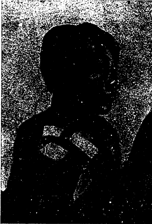
א סארוואונדעסער פון אן אויפרייס-קויל בעאיסן שאנכאיער שטרייק

ס'איז באקאנט דער שטרייק אין שאנכאי, וואס איז פארגעקור- מען אין 1925 יאר, און האט געדויערט עטלעכע באדאשים. דערדא- זיקער שטרייק האט זיך אנגעהויבן ווי א פראטעסט-שטרייק קעגן דעם, וואס אף די טעקסטיל-פאבריקן שלאגן די אויסלענדישע אויפ-